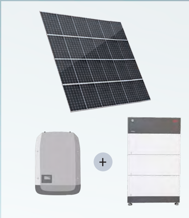
PV-PAKET 4 (10,32 kWp) 19.499,-- Euro – 0% MwSt.

PV-PAKET 3 (8,60 kWp) Photovoltaikanlage (8,60 kWp) bestehend aus: ■ Mono-Hochleistungsmodule (*) ■ 1 Stück Wechselrichter (*) ■ 1 Stück BYD-Stromspeicher Battery Box Premium HVS 7.7, 7,70 kWh Nennkapazität (Netto), nutzbare Kapazität Netto (95 %) 7,32 kWh ■ Befestigungssystem Novotegra für Montage auf einer Betondachsteineindeckung (das Befestigungssystem wird bei flach geneigten Dächern optional angeboten) ■ Modulmontage senkrecht, einlagig geklemmt (bis max. 2 Modulfelder) ■ Verkabelung der kompletten Anlage ■ Herstellung des Potentialausgleichs ■ Elektrischer Anschluss der PV-Anlage ans Netz inkl. benötigtes AC-Material ■ Anmeldung beim Netzbetreiber ■ Fertigmeldung und Inbetriebnahme (**) ■ DC-Überspannungsschutz (bis 2 MPP) VK: 17.899,00 € (0 % MwSt.)